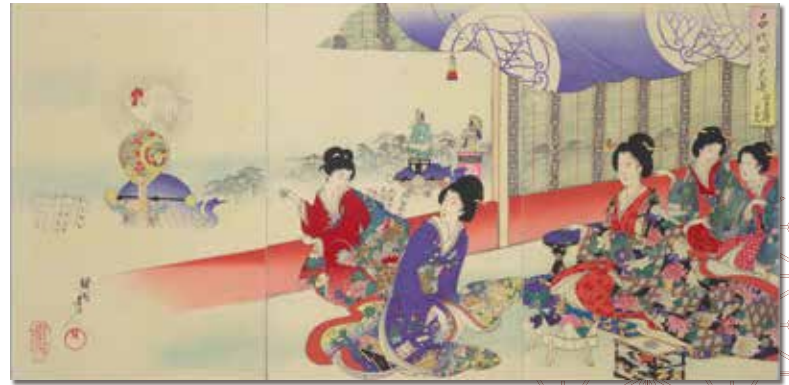
千代田の大奥 神田祭禮上覧

明治時代に楊洲周延(1838-1912)によって描かれた浮世絵のシリーズ「千代田の大奥」等で、江戸幕府の行事や儀式をご紹介します。