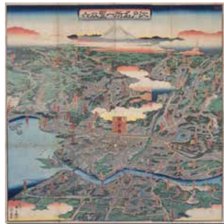
江戸名所一覧双六